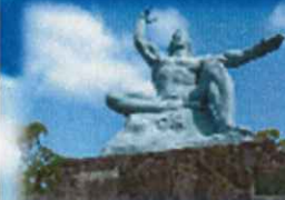
「平和祈念像（長崎）／北村西望作」

戦後70年以上が経過し、被爆者の高齢化が進んでいます。唯一の戦争被爆国として、被爆者の体験や平和への想いを次世代に語り継ぐために、広島、長崎では、被爆者から直接受け継いだ体験を語り継ぐ「伝承者」や、被爆者の体験記を朗読する朗読ボランティアの養成を行っています。